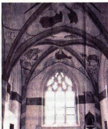
Dans le chœur des fresques uniques du 15 ème siècle remises à jour

Hormis le travail spectaculaire sur les fresques magnifiquement conservées qui n'ont subies que de légères retouches et la pose de vitraux neufs sobres et lumineux, des travaux de rénovation ont été entrepris sur l'autel en bois, sur deux stalles, sur une porte à claire voie ainsi que sur la table de communion avec rétablissement des scellements laté-